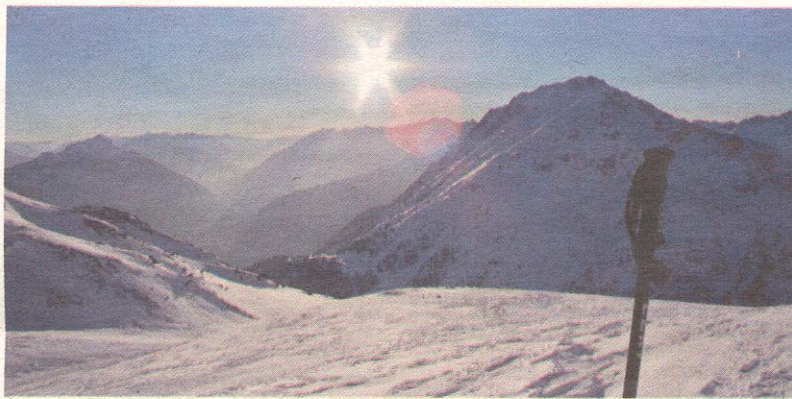
Das Hölltörl lohnt sich bei schönem Wetter. Eine kurze Rast hat man sich hier bereits verdient.