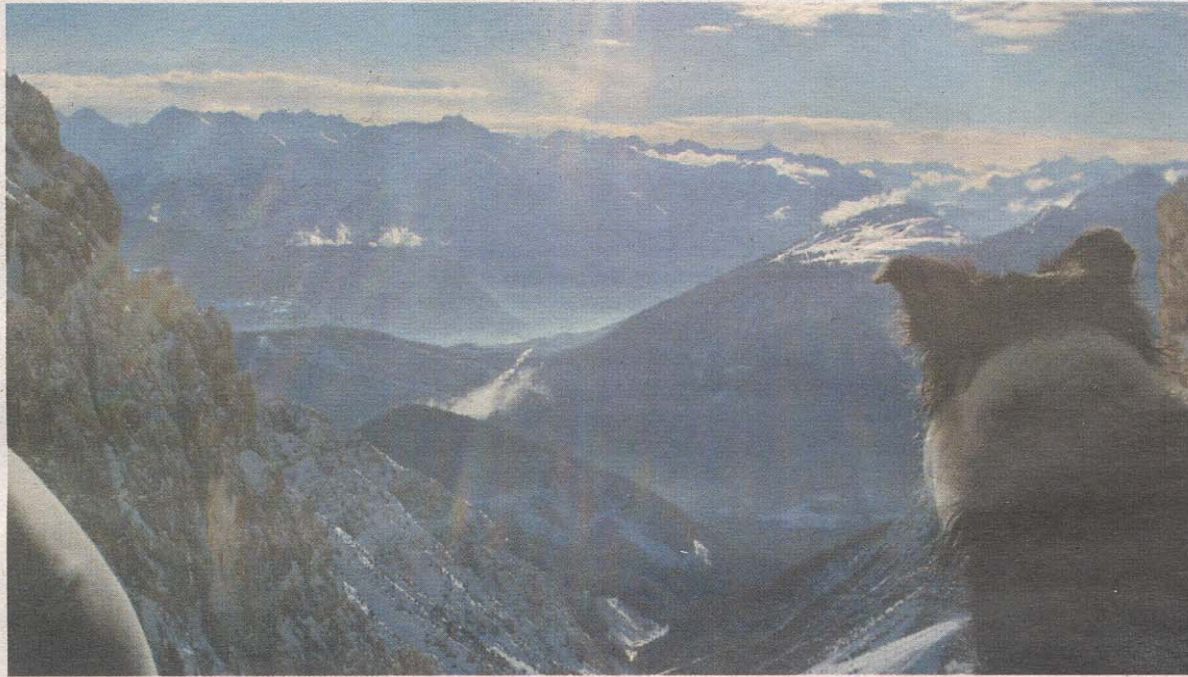
Die Grünsteinscharte bietet einen herrlichen Blick ins verschneite Tal. Bei der Grünsteinumgehung locken zwei lange Abfahrten.

START. Ausgangspunkt ist der Parkplatz beim Arzkasten in Obsteig. Hier sind vier Euro Parkgebühr zu bezahlen, wobei zwei Euro bei einer Konsumation in Obsteig rückvergütet werden. Vom Arzkasten geht es anfangs den Rodelweg entlang. Nach der Brücke wechselt man links auf die Abfahrt und folgt dieser bis zum Lehnberghaus auf 1.554 m. Beim Lehnberghaus geht der Aufstieg links vorbei Richtung Ursprung (Wasserfassung) und folgt dann den Spuren in die „Hölle“. Beim „Großen Stein“ angekommen, befindet sich westlich der Grünstein mit 2.666m und östlich die Griesspitze mit 2.741m. Zwischen den beiden wichtigen Kalkgipfeln kommt der anstrengendste Teil der Tour, nämlich der Aufstieg zur Grünsteinscharte (ca. 1 bis 1,5 Stunden). Auf 2.272 Metern angekommen, hat man sich dann eine Pause redlich verdient!